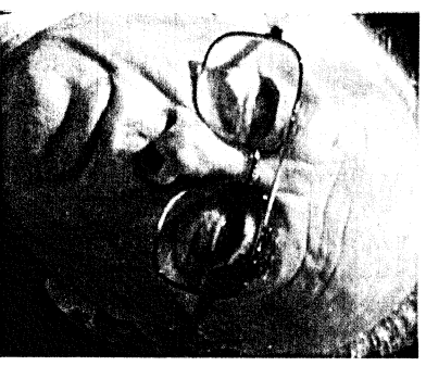
Yitzak Rabin, lehen ministro laborista. 1995ean hil zuten.

PALESTINARRAK. 1968ko urtariletan Arafat ez zen PAEKo (Palestinarren Askapenerako Erakunde) buruzagia baina bai Al-Fatahkoa (konkista esan gura du), geroa PAEn taldeak indar izan zuten. 1968ko martxoaren 21ean, Al-Fatah-ko mila gerturik, gogor eutsi zioten 15.000 soldadu israeldarren erasoari.